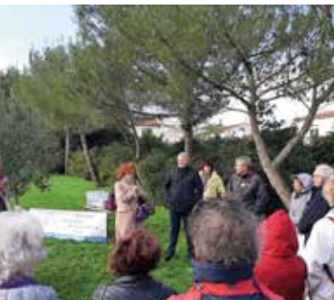
La Rochelle (Charente-Maritime)